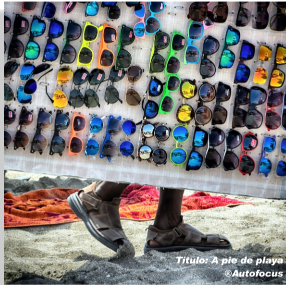
Titulo: A pie de playa