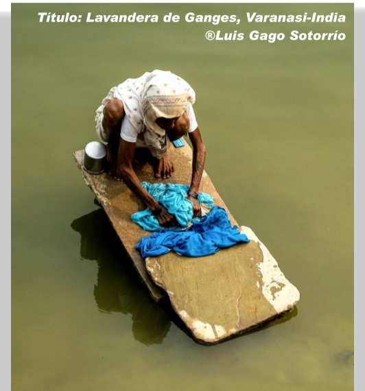
Titulo: Lavandera de Ganges, Varanasi-India