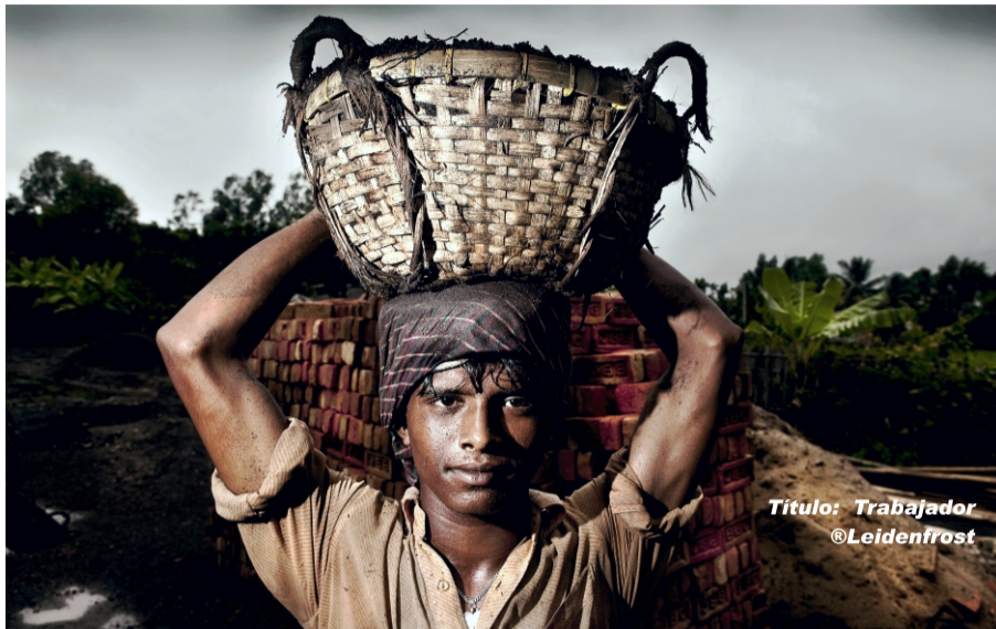
Titulo: Trabajador